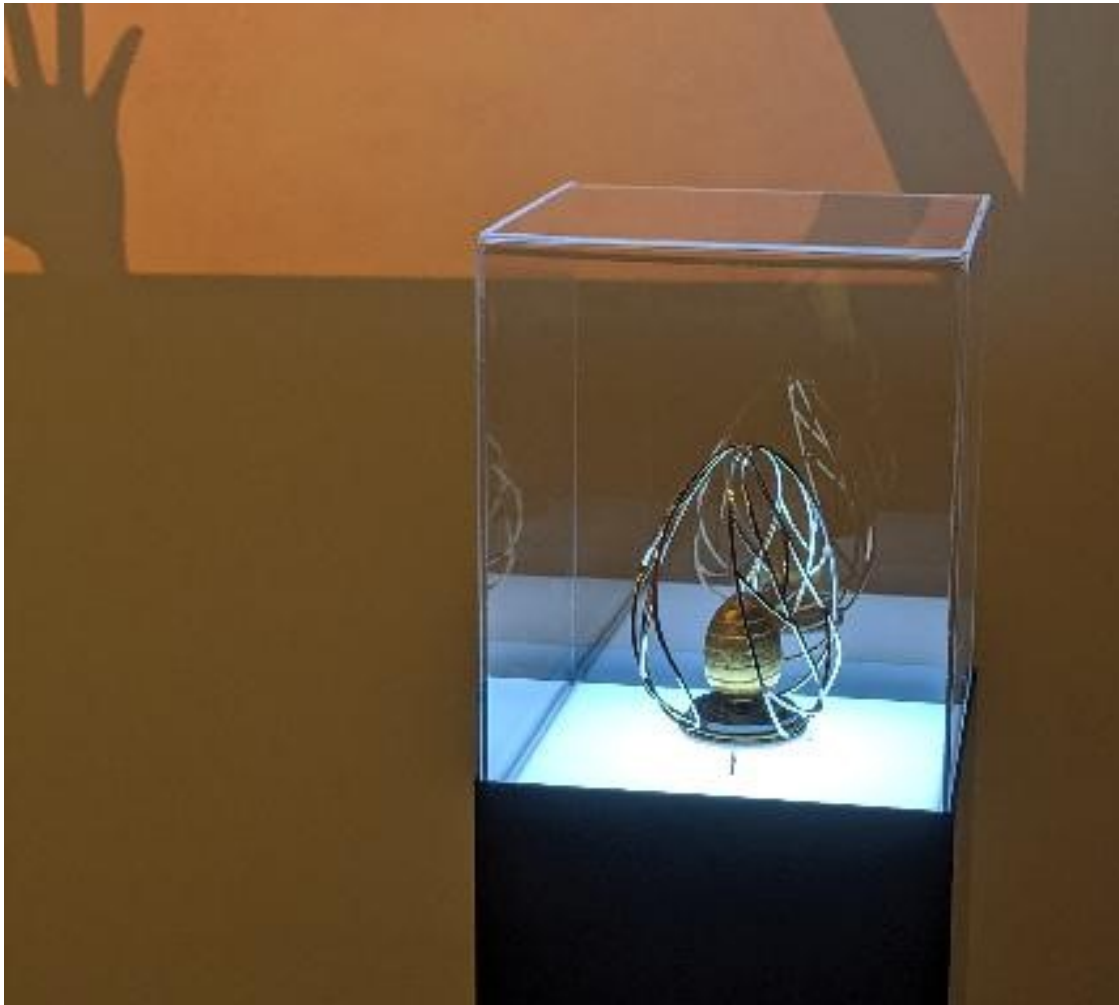
Nieuw Belgisch bordspel zet schattenjacht ter waarde van 210.000 euro in gang