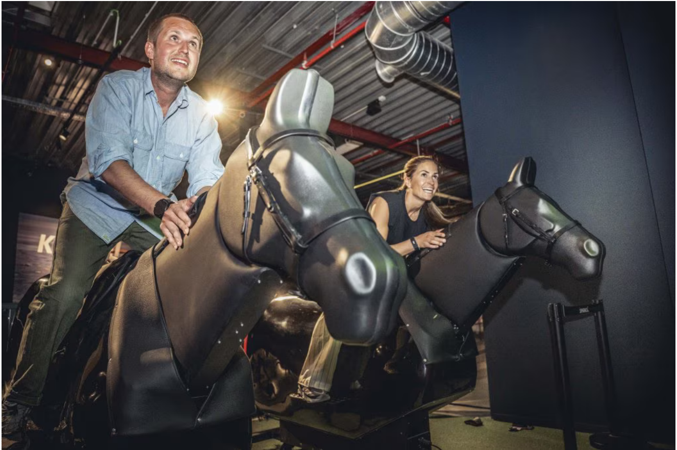
De mechanische hengsten behandel je best met liefde.

De opkomst van 'sportainment' vindt ze logisch. 'Het is een gezond en entertainend alternatief voor café- en restaurantbezoeken.' Mertens, die liever buiten sport, ziet vooral mogelijkheden voor bedrijven of familie-uitjes. 'Je moet niet de grootste speler zijn. Iedereen kan meedoen, zelfs de bomma, in haar eigen ritme', zegt hij lachend.