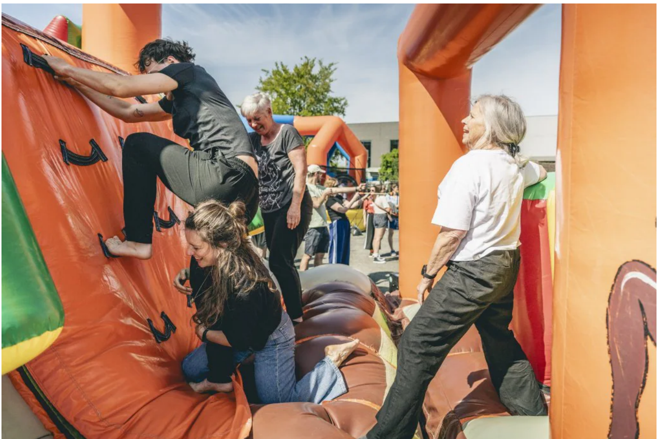
Worstelen met de hindernissen op het springkasteel.

Waarom het precies werkt, is voor de wetenschap nog onduidelijk. 'Wellicht beschermen de prikkels die je binnenkrijgt tegen de achteruitgang van de cognitieve functies', zegt Engelborghs.